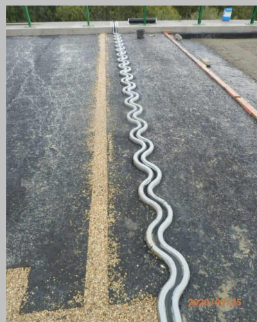
SO 221 - silniční most