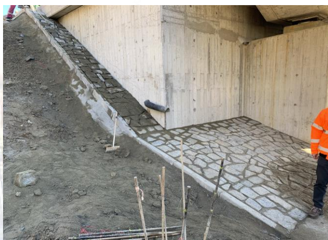
SO 223 - železniční most