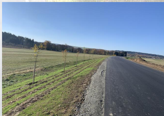
SO 102 - výsadba keříků a stromků