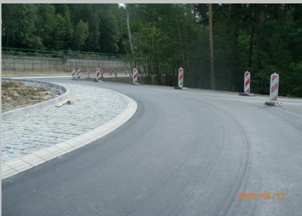
dokončení dláždění prstence z velké žulové kostky