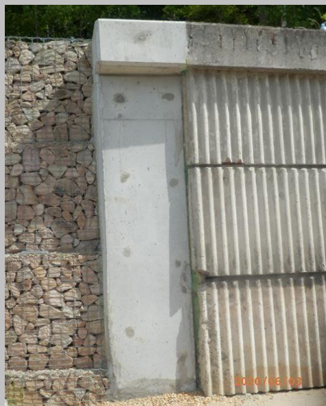
propojení gabionové zdi se stávající zdi