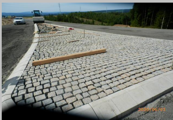
dláždění z malých žulových kostek